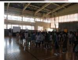
うんちっ体操で元気に健康、運氣アップ