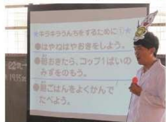
キラキラにするために