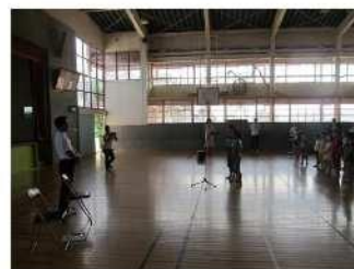
児童のお礼のようす