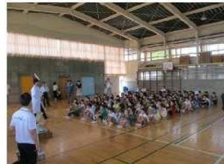
キラキラうんちにしよう