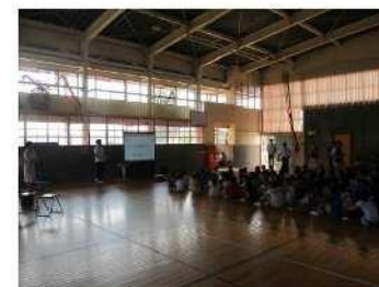
うんちっ教室から